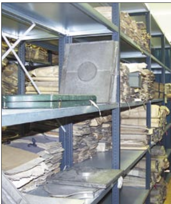
Raktárrészlet (Egyházmegyei Levéltár – Győr)

2.) A főkáptalani, káptalani levéltárak rendjét általában a káptalani jegyzők (a káptalan által fizetett ügy-