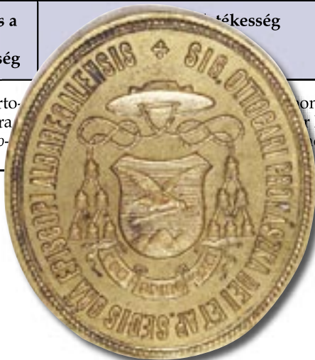
Prohászka Ottokár püspök (1905-1927) typariuma