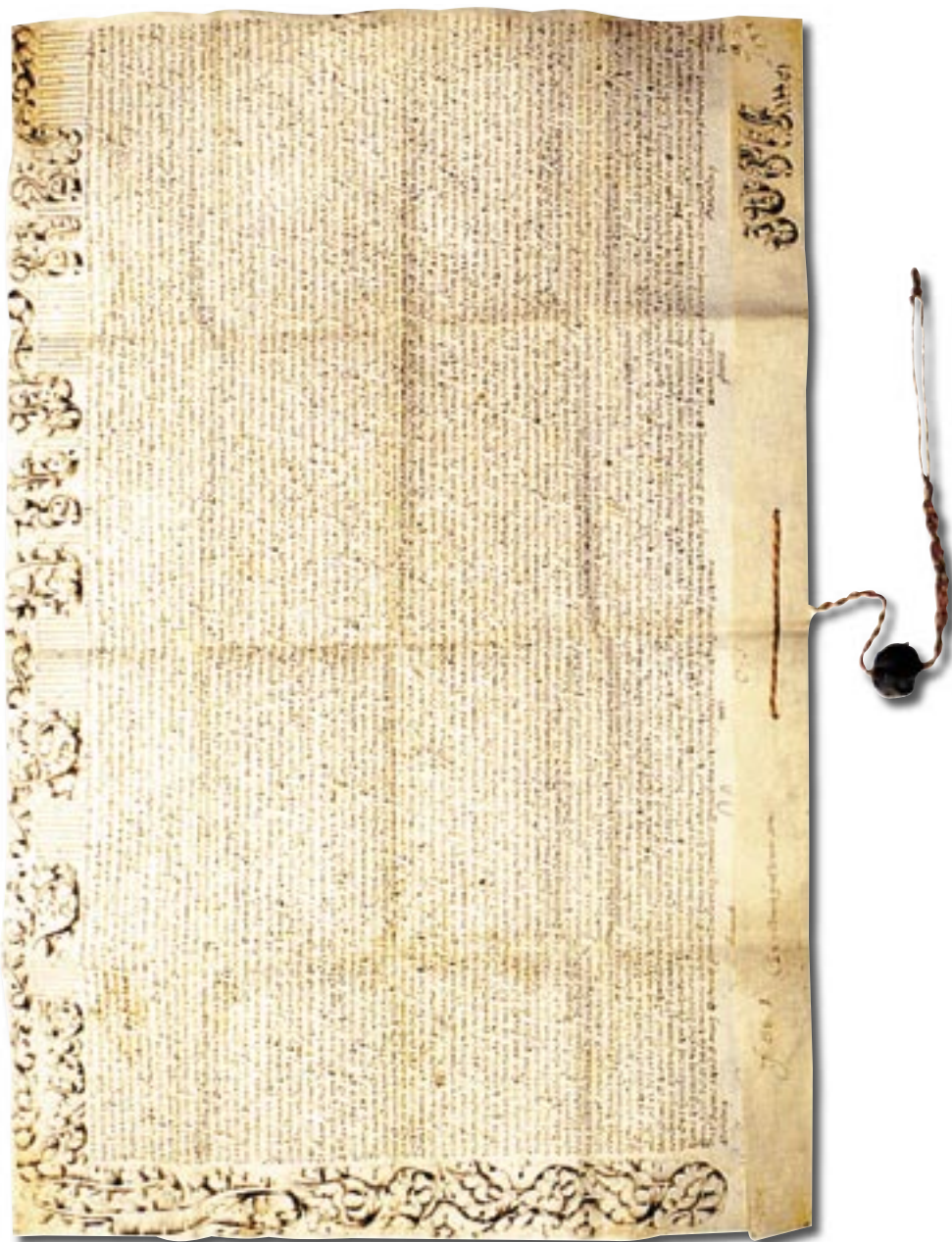
A székesfehérvári püspökség alapítólevele, 1777. VI. Pius (Székesfehérvári Püspöki és Székeskáptalani Levéltár)