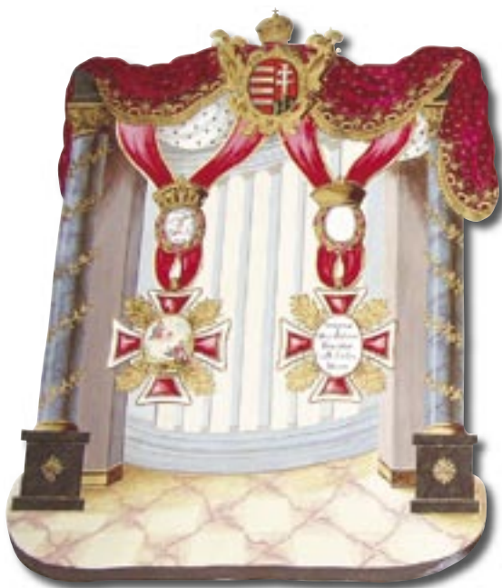
I. Ferenc káptalani jelvényt adományozó oklevele, 1808 (Egyházmegyei Levéltár – Győr)

hatjuk, hogy az 1950 előtti (11) és az 1950-1990 közötti (13) kiadványok számának összegét meghaladták az 1990 utáni kiadványok (24:26). A rendszerváltás után tehát felgyorsult a kiadványi munka, a kiadványok megjelenése. Átalakult viszont témájuk, struktúrájuk: legnagyobb mértékben az ún. „hasznos kiadványok”, a levéltárak szempontjából is hasznosítható adattárak, levéltártörténeti, archontológiai stb. munkák, ill. a forráskiadványok száma szaporodott az utóbbi évtizedben. Míg a levéltári anyagot ismertető segédletek terén, különösen a közép-szintű segédleteket tekintve nem történt lényeges előrelépés, sőt az elérhető kiadványok