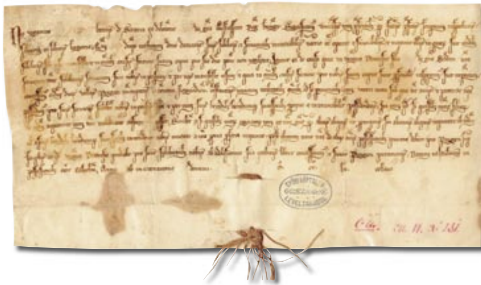
Ugrin szőrényi bán oklevele, 1268. (Egyházmegyei Levéltár – Győr)

3.) A plébániák levéltárai tulajdonképpen „tükörképei” a püspöki levéltárakban található, plébániákra vonatkozó iratanyagnak, hiszen az iratok zömét a püspökséggel folytatott levelezés teszi ki, s ami itt eredeti, a másik helyen fogalmazványként meg kell lennie és viszont. A helyzet azonban – pl. a mindkét helyen jelentkező, de eltérő módon, mértékben megvalósuló iratvesztés miatt – ennél jóval bonyolultabb. A plébániákon őrzött anyagot a hivatali levelezésen kívül értékes helyi összeírások, a plébánia történetéről vezetett „historia domusok”, iskolaszéki iratok egészíthetik ki, időnként céhek,