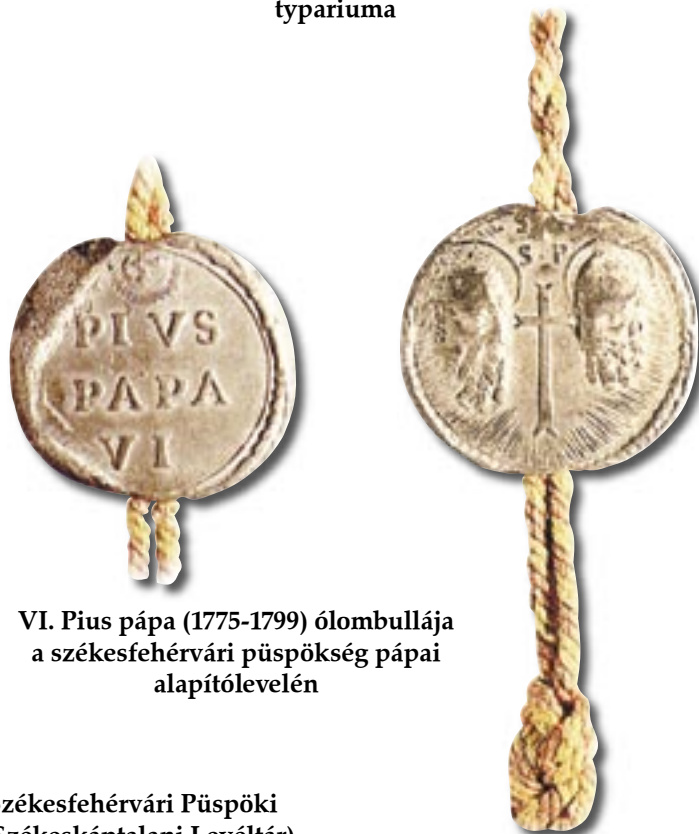
VI. Pius pápa (1775-1799) ólombullája a székesfehérvári püspökség pápai alapítólevelén

(Székesfehérvári Püspöki és Székeskáptalani Levéltár)