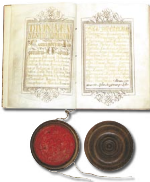
A székesfehérvári püspökség császári alapítólevele, 1777. Mária Terézia (Székesfehérvári Püspöki és Székeskáptalani Levéltár)

házi levéltárakban (munkatársaik egyébként visszatérve általában kedvező tapasztalatokról számoltak be a Társulat rendezvényein). Megjelentek az első levéltárismertető publikációk, leírások is (elsőként a gyulafehérvári káptalan [1880, 1898] és a pannonhalmi főapátsági levéltár [1896] esetében), és forráskiadványok formájában kezdtek el közölni a levéltárak legfontosabb anyagait (elsősorban a középkori okleveleket). Az 1874. évi XXXV. tc. bevezette a közjegyzői intézményt, s ezzel véget vetett a hiteleshelyek tevékenységének (az iskolázottság növekedésével, az írásbeliség terjedésével a század folyamán ez a tevékenység már egyébként is jelentősen visszaesett). Új „országos” iratokat ezután már nem adtak ki a káptalanok, a régieket viszont továbbra is elkülönítve (országos levéltárnak nevezve) tárolták, kezelésüket a későbbiekben is állami törvények szabályozták. A káptalani magán- és hiteleshelyi levéltárak őrzőhelye továbbra is a templomok épülete maradt, innen általában csak a 20. század második felében költöztették ki őket.