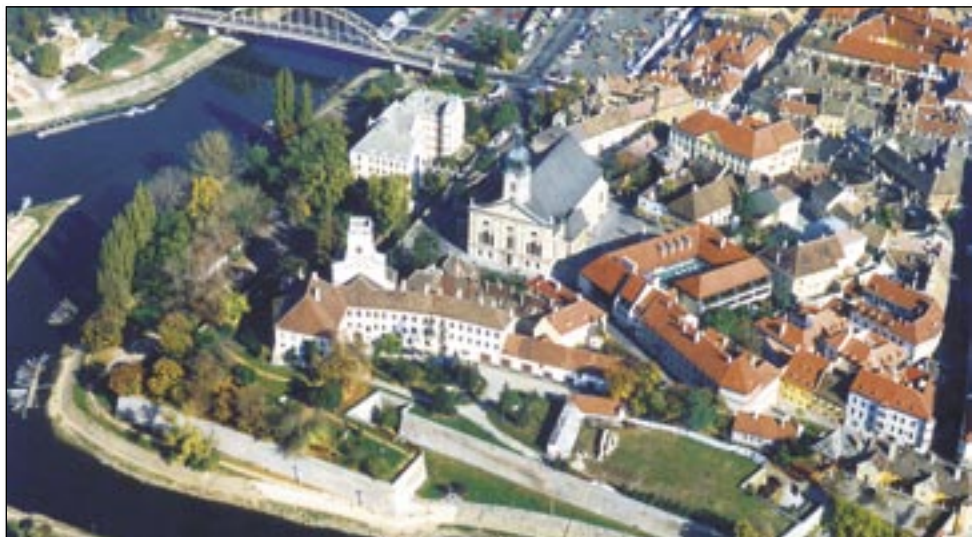
A Káptalandomb a helyreállított Püspökvárral és a Bazilikával (Győr)

A katolikus egyházi levéltárakkal kapcsolatos kiadványok száma összesen 50. Ennek kétharmada önálló kiadvány (könyv, füzet), egyharmada tanulmány jellegű publikáció. Ha kiadási idő szerint tagoljuk őket, akkor lát-