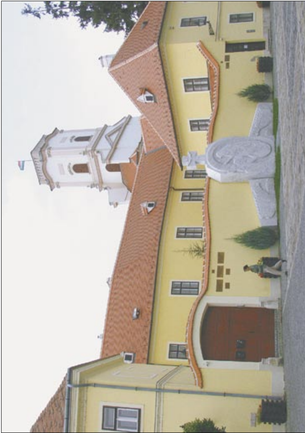
A Győri Egyházmegyei Levéltár épülete háttérben a püspökvárral