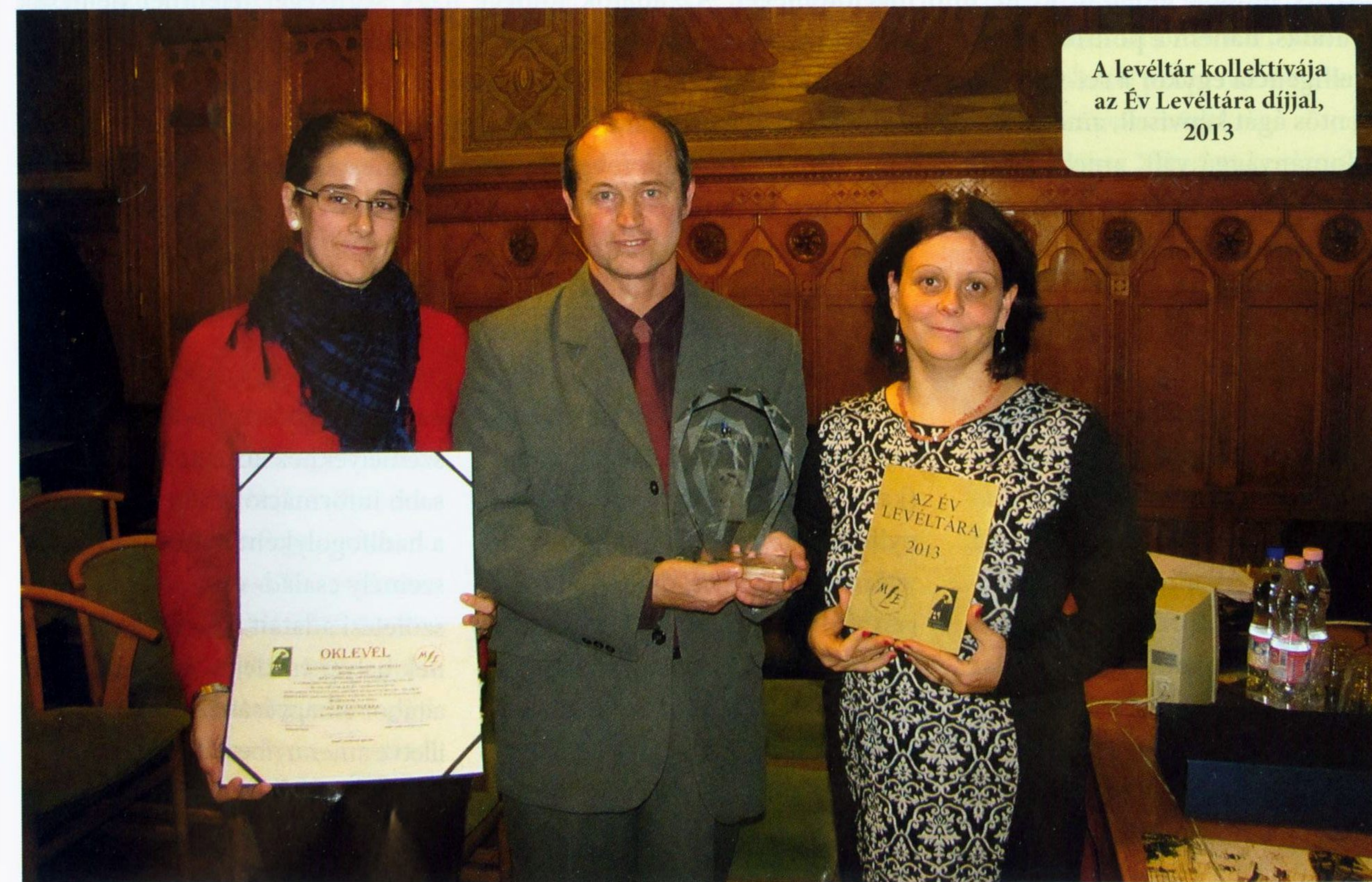
A levéltár kollektívája az Év Levéltára díjjal, 2013

További információk: https://archivum.asztrik.hu