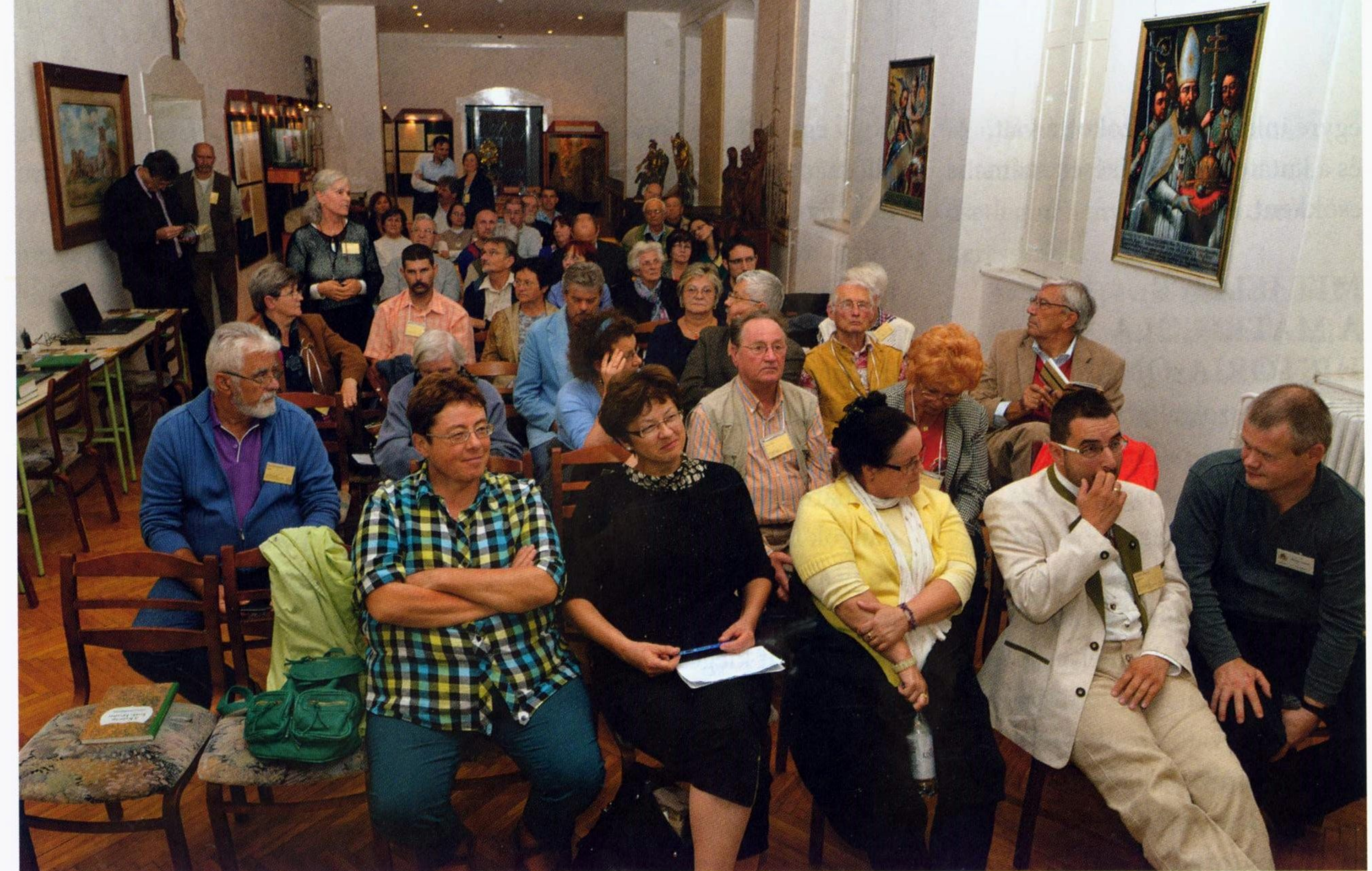
A Kalocsai Főegyházmegyei Levéltár Kutatók Éjszakája rendezvénye, 2014

szert fenntartását és a tartalom további fejlesztését és bővítését is lehetővé tették (egy-egy negyedéves hozzáférést először három-ezer, majd egy évtizeden át ötezer forintot fizettek). Nagyrészt ennek köszönhető, hogy ma már 2 millió képfelvétel kutatható a levéltár anyagából, és megítélésünk szerint a rendszer fenntarthatóságát igazolják e-kutatás szolgáltatásunk sárokszámjai, a legfontosabb statisztikai adatok. Im már 153 hónap távlatában több mint 6 ezer