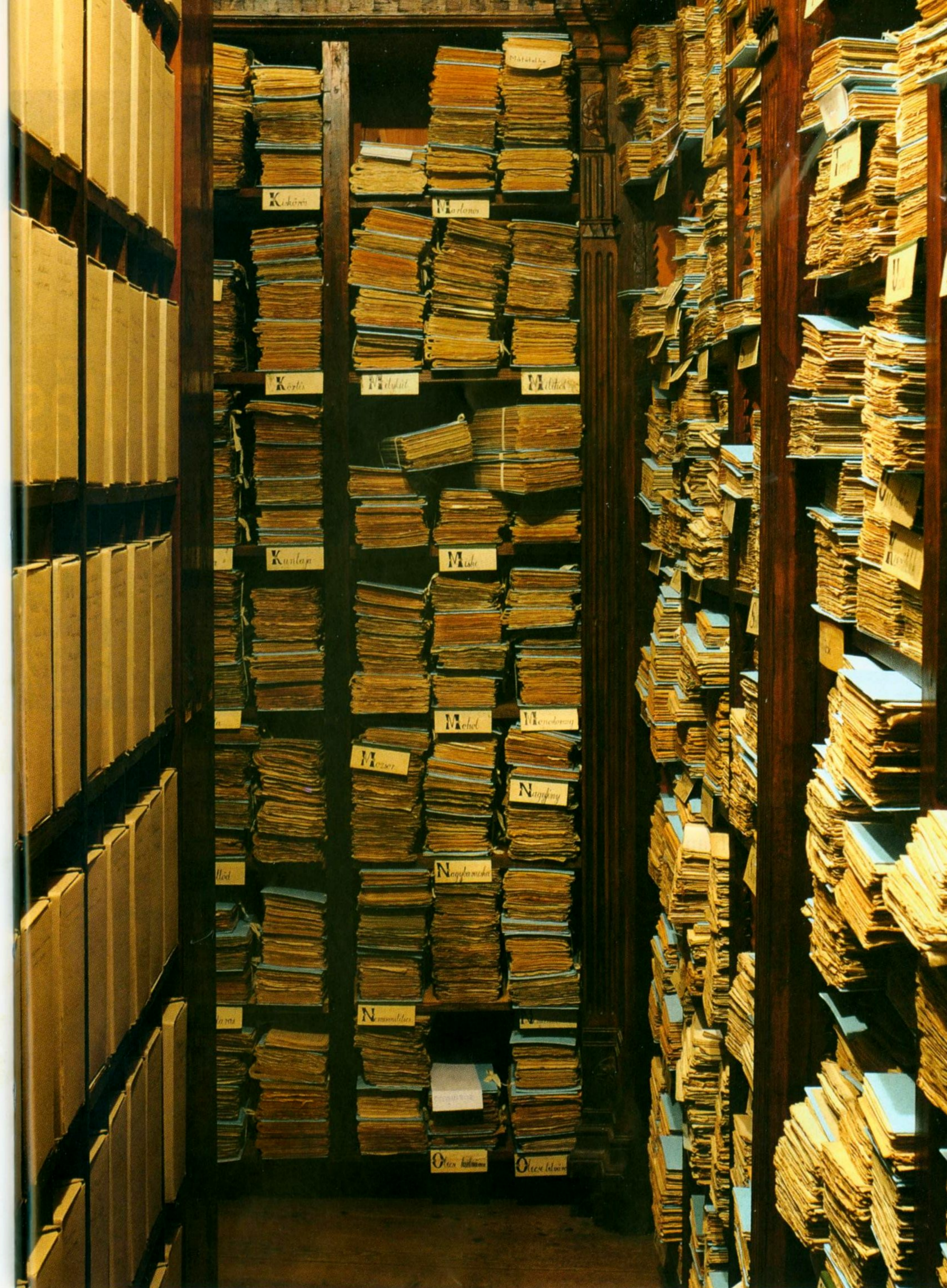
Levéltári raktár enteriőr, 2011

dott az online kutatási tartalom-szolgáltatások igénye. A levéltári források internetes elérhetőségének lehetőségét az őrző intézményekben kezdetben „távolinak” érezték, megfelelő eszközök és anyagi források hiányában, a tömeges digitalizáláshoz szükséges feltételek megteremtésére várva. A kényszerű várakozás mellett azonban folyt az útkeresés is, s a „kísérletezések” korában, helyi megoldások keresésében tulajdonképpen kedvezőbb lehetőségek nyíltak a kis méretű egyházi levéltárak számára, ahol nem kellett a nagy intézményekre jellemző adminisztrációs és döntéshozó szinteket végigjárni,