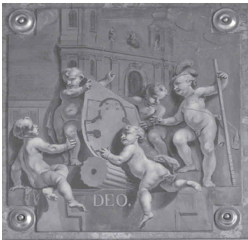
Maulbertsch grisaille-ja a főszékesegyház építéséről a kalocsai érseki kastély díszterméből (1784)

E földrajzi térségben a felmérés idején sok ortodox és protestáns élt, és a katolikusoknak nem volt nagy szerepük. Az egyházmegye déli részének (Bács vármegye) lakossága többségében illír-ortodox, nagy