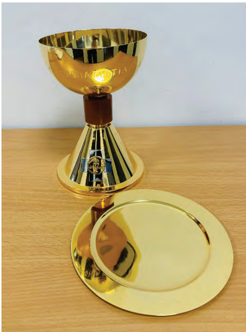
Eucharisztikus Kongresszusra készült kehely. Emőd, Urunk Mennybemenetele templom. 2005.1.993. Eg.