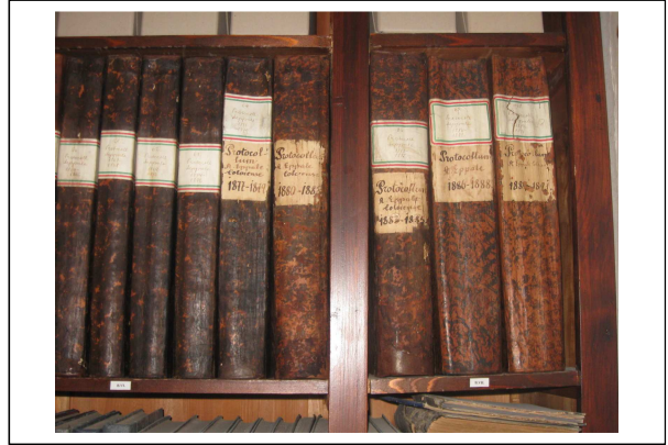
A kötések konzerválás előtt és után: